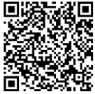
村里街路門牌查詢網站