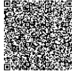
桃園市中壢區公所網站查詢學區

Q3:如果收到入學通知單，才發現不是自己中意的學區學校，是否可以去中意的學校報到，不理會本通知單？