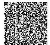
新生入學報到完整流程(線上報到)

元生國小:需先資格審查 中平國小:需先資格審查 青埔國小:需先資格審查 林森國小:需先資格審查 文化國小:需先資格審查 青園國小:需先資格審查 芭里國小:需先資格審查