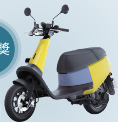
GOGORO VIVA 電動機車x1 (芥末黃)